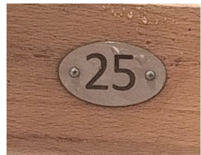
numer porządkowy- numeracja miejsc